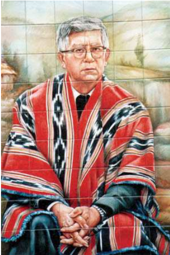
Monseñor Leonidas Proaño, Obispo de los Indios y de los Pobres, referencia moral y guía vital de Luís Ochoa